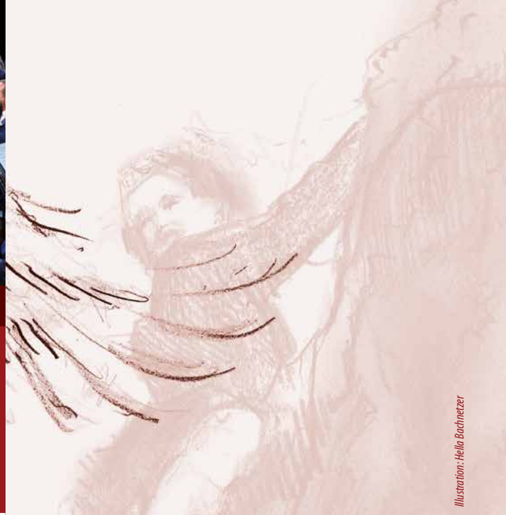
Illustration: Hella Bachmetzer

Nähere Informationen unter wunderkammer.tirol